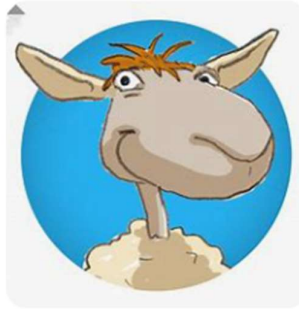
Body2Brain - Apps on